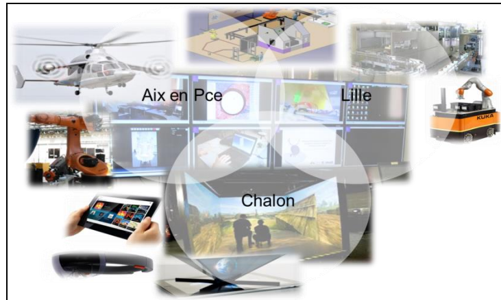
Figure 1 : Systèmes CyberPhysique pour l'Industrie du Futur

La figure 2 montre la structuration des expertises scientifiques du LISPEN dans un projet cohérent fédérateur des ressources des trois sites (Aix-en-Provence, Chalon sur Saône et Lille) :