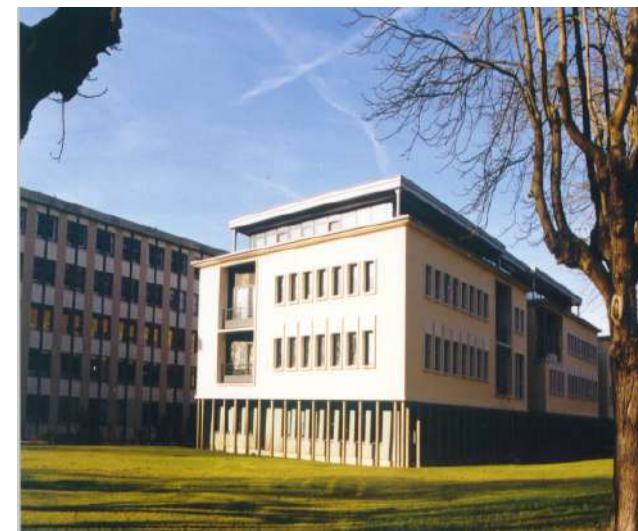
Cité administrative Tirlet - 5 rue de la Charrière 51036 Châlons-en-Champagne cedex