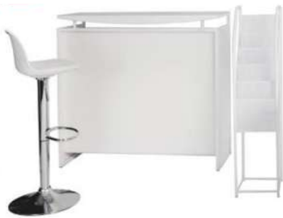
Chaise haute Comptoir Porte document