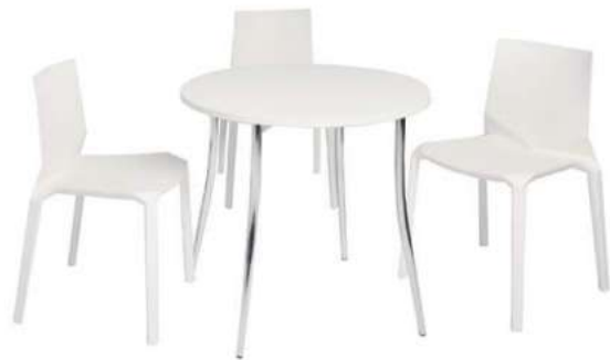
Chaises et table