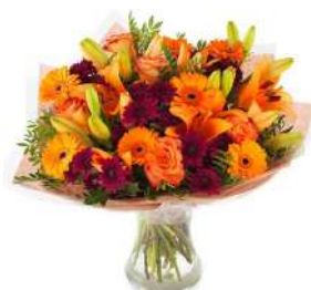
Bouquet de fleurs